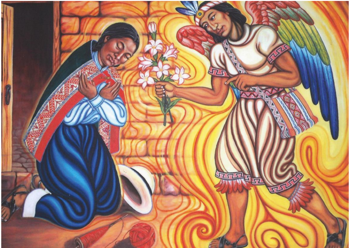
Themakaart: De aankondiging – een nieuw begin!