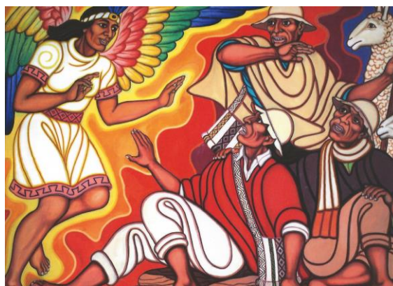
De herders horen van de geboorte