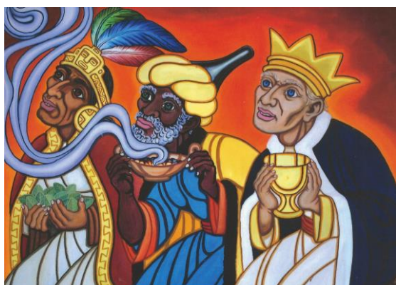
De wijzen brengen geschenken