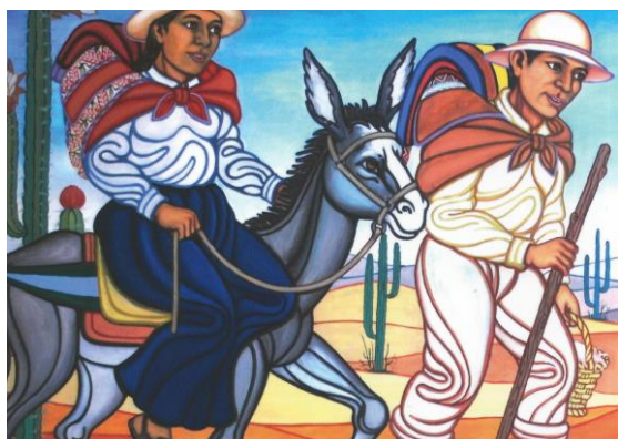
Jozef en Maria op weg naar Bethlehem