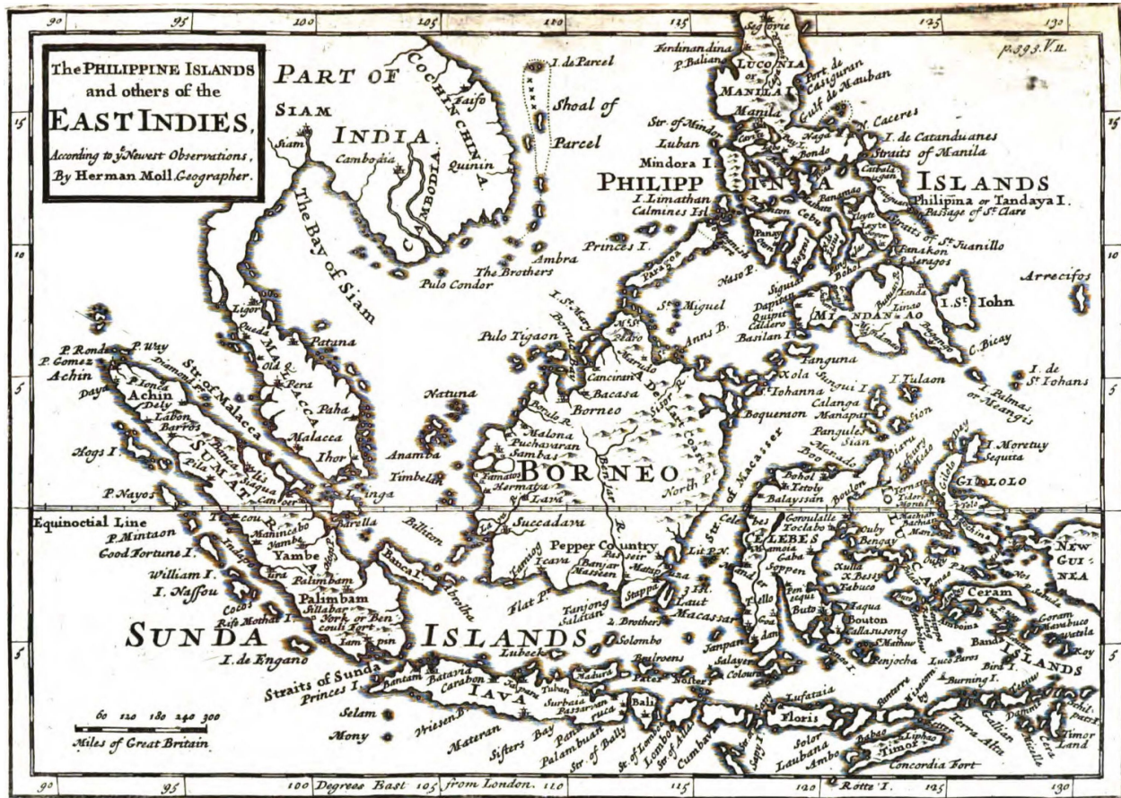
A Collection of Voyages and Travels, II, 292.

Hoewel genoemde havens een belangrijke rol speelden in de uitvoer van specerijen van de Molukken, Ambon en Banda, liep niet alle export van de Grote Oost via Java en Sumatra. Een deel ging via Majoe (Mayu; Mineau, Meau), een klein kruidnagleiland halverwege de Molukken en Noord-Celebes. Behalve dat Ternate er zijn prauwen liet bouwen, werden er allerhande goederen uit Oost- en Zuidoost-Azië (Johor, Patani, Japan, de Filippijnen, Cochinchina, Cambodja, Siam, China) geruild tegen parels, specerijen, paradijvogels, zeekomkommers, vogelnestjes en andere lekkernijen.