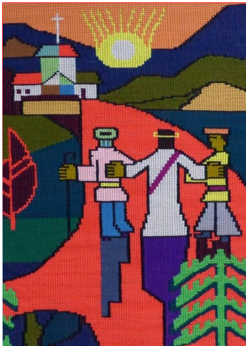
Een nieuwe weg met Christus - Zendingserfgoedkalender 2023

DIGITALE NIEUWSBRIEF STICHTING ZENDINGSERFGOED / ZENDINGSERFGOEDHUIS Nr. 28 September 2022