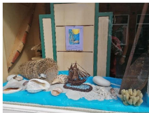
Aan verre kusten

Dit jaar kon, na twee coronajaren, op 10 september de 'Slandse Jaarmarkt' weer worden gehouden. Het zendingserfgoedhuis staat precies in het gebied van de markt en we besloten om de deuren drie uur lang te openen om voorbijgangers de gelegenheid te geven onze tentoonstelling 'Aan verre kusten - zending aan en vanaf de stranden' te bekijken. Zo'n 50 personen maakten van die gelegenheid gebruik.