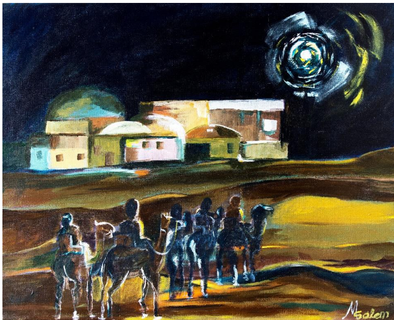
De wijzen uit het oosten volgen de ster naar het kind van Bethlehem (afbeelding kerstkaart)

De kalender kost €9,00. Informatie over de speciale prijs voor commissies en diaconieën en de wijze van bestellen vindt u op onze website, Evenals vorig jaar bieden wij ook een setje mooie kerstkaarten aan met afbeeldingen die door dezelfde kunstenaars zijn gemaakt.