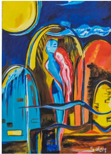
Van het duister naar het licht (bonuskaart)