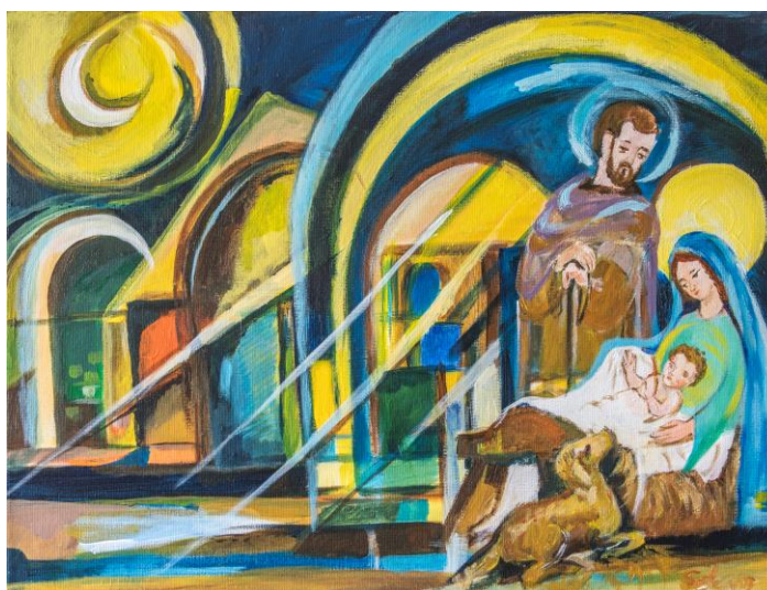
De geboorte in Bethlehem