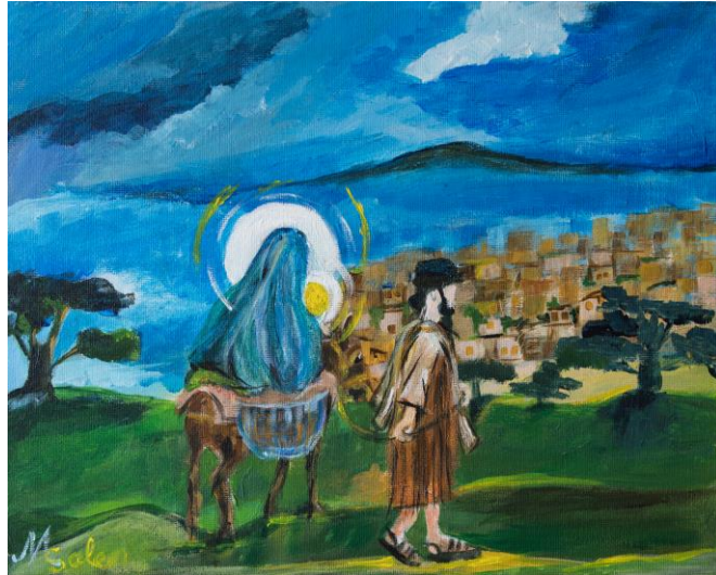
De vlucht naar Egypte