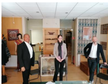
Oriëntatiebezoek medewerkers Catharijne Convent

Onze stichting is - in de Nederlandse 'museumwereld' - vrij klein. Het is belangrijk om na te denken over de toekomst en daarom proberen wij contacten te leggen en te onderhouden met andere musea die collecties op vergelijkbare terreinen als de onze beheren. Museum Catharijneconvent in Utrecht richt zich niet meer, zoals in het verleden, slechts op Nederlandse religieuze kunst. Het museum heeft twee mensen aangetrokken die zich er speciaal voor in gaan zetten om het erfgoed van migrantenkerken en internationale kerken een plek te geven in de collectie. Wellicht kan onze stichting iets voor hen betekenen en kan er in de toekomst op enige wijze samengewerkt worden.