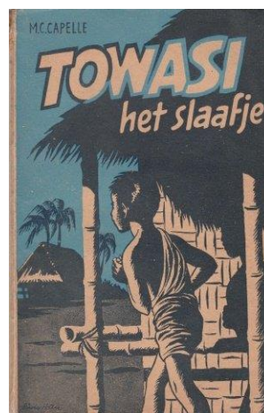
Zendingsverhaal voor de kinderen

In de loop der jaren hebben de zendingsorganisaties allerlei materiaal uitgegeven en verspreid.