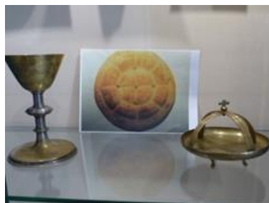
Avondmaalsstel Syrisch-Orthodoxe kerk Hengelo

Op woensdag 24 oktober werd in het zendingserfgoedhuis een lezing gehouden over iconen, kruizen en andere attributen uit vooral de tradities van de Oriëntaals orthodoxe kerken in ons land. Er werd stilgestaan bij de kerkgeschiedenis van de Koptisch-, Ethiopisch-, Eritrees- en Syrisch-Orthodoxe kerken en de Armeens-Apostolische Kerk. Verder werd besproken hoe je naar iconen kunt kijken: de beeldtaal en de kleurtaal die iconen zo bijzonder maken. De lezing sloot aan bij het onderwerp van de tentoonstelling die we hadden ingericht naar aanleiding van de zendingserfgoedkalender van dit jaar.