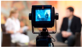
Het verhaal vsan de zending

bezig fondsen te benaderen om deze aankoop te dekken.