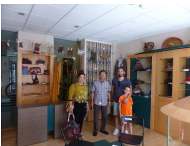
Familie Siwu uit de Minahasa

De kalender geeft verder een introductie in de geschiedenis van Bali en de belangrijke plaats die het Hindoeïsme op Bali inneemt. Ook de geschiedenis van de zending wordt belicht. U kunt de kalender voor € 9,00 bestellen via onze website. Commissies en diaconieën betalen € 6,00 per kalender. Bestellingen vanaf 10 stuks worden zonder portokosten toegezonden. Alle informatie hierover vindt u op de website.