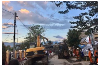
Verwoesting alom in Palu