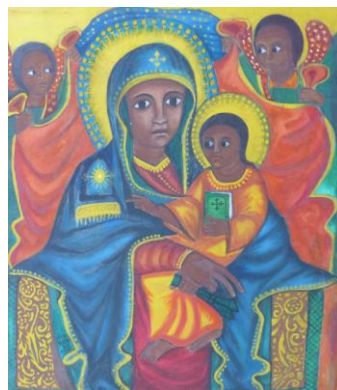
Ethiopische icoon nieuw verkregen uit Utrecht

Von, te gast in het Zendingserfgoedhuis. Zij lieten zich informeren over het werk van het Zendingserfgoed en het doel van de collectie. De rector van de oudste theologische opleiding van de Minahasische Kerk (Indonesië) was onder de indruk van de verzameling. Ook de Zendingserfgoedkalender viel in de smaak en hij gaf aan dat hij inspiratie had opgedaan om een Minahasische editie uit te brengen.