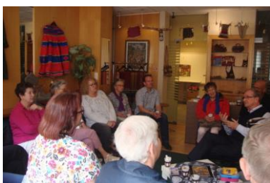
In gesprek met de groep

Beiden genoten van de herkenning van veel voorwerpen en zij zullen met genoeg gemeenten op het bestaan van het Zendings-erfgoedhuis wijzen.