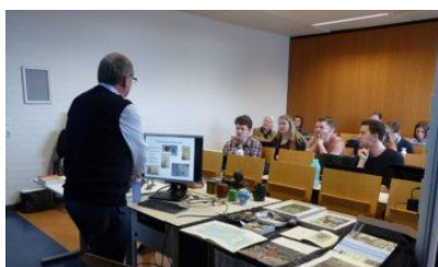
In de collegebanken in Amsterdam

Deze keer wel aandacht voor een college aan studenten van de VU/PTHU over zending, aan de hand van voorwerpen uit de collectie. Een selectie van voorwerpen werd ook gebruikt om in Wuppertal een lezing te houden over kunst en religie in Indonesië.