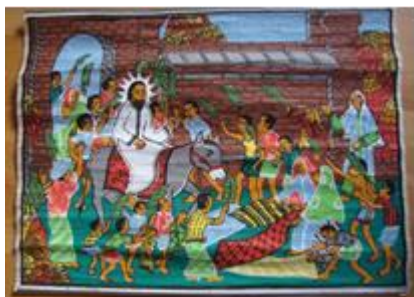
De intocht in Jeruzalem