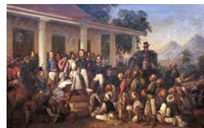
Diponegoro gevangen genomen – Raden Saleh

Speciaal voor de tentoonstelling waren een paspop en een kledingrek aan de inventaris toegevoegd, om sommige kledingstukken beter te kunnen tonen. We waren zelf verrast hoeveel diversiteit er rond dit thema in de collectie te vinden is. Zo’n dertig mensen stapten even binnen om te komen kijken en dat leverde geanimeerde gesprekken op.