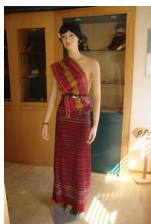
Een gepaste paspop

De rest van de groep werd, bij de meegebrachte lunch, getraakteerd op een uiteenzetting over het werk van het zendings-erfgoed. Het kwam goed uit, want de tentoonstelling voor de voorjaarsmarkt Zuidland op 12 mei stond al grotendeels opgesteld. In die setting werd verteld over het werk en werd dit met enkele voorbeelden geïllustreerd. Een leuke en, naar we denken, leerzame tussenstop. “Zo dichtbij en toch onbekend”, was een veel gehoorde reactie.