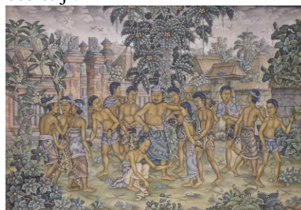
Jezus en de overspelige vrouw - I Ketut Lasia

Voor 2019 zijn de afbeeldingen van Balinese kunstenaars in de typische stijl van de Hindoeïstische traditionele hofschilderkunst wajang of kamasan . De geschiedenis van het eiland en van de zending en de kerk daar, het bijzondere Hindoeïsme en de typische schilderkunst zijn beschreven. In tegenstelling tot geheel Indonesië, dat voor meer dan 80% de Islam aanhangt, is de overgrote meerderheid van de Balinezen Hindoe gebleven. Protestantenvormen niet meer dan 1% van de bevolking. Maar wel in een geheel eigen Balinese stijl.