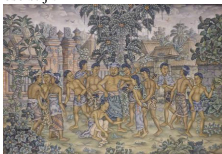
Jezus en de overspelige vrouw - I Ketut Lasia

Voor 2019 zijn de afbeeldingen van Balinese kunstenaars in de typische stijl van de Hindoeïstische traditionele hofschilderkunst wajang of kamasan . De geschiedenis van het eiland en van de zending en de kerk daar, het bijzondere Hindoeïsme en de typische schilderkunst zijn beschreven. In tegenstelling tot geheel Indonesië, dat voor meer dan 80% de Islam aanhangt, is de overgrote meerderheid van de Balinezen Hindoe gebleven. Protestantenvormen niet meer dan 1% van de bevolking. Maar wel in een geheel eigen Balinese stijl.