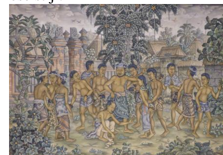
Jezus en de overspelige vrouw - I Ketut Lasia

Voor 2019 zijn de afbeeldingen van Balinese kunstenaars in de typische stijl van de Hindoeïstische traditionele hofschilderkunst wajang of kamasan . De geschiedenis van het eiland en van de zending en de kerk daar, het bijzondere Hindoeïsme en de typische schilderkunst zijn beschreven. In tegenstelling tot geheel Indonesië, dat voor meer dan 80% de Islam aanhangt, is de overgrote meerderheid van de Balinezen Hindoe gebleven. Protestantenvormen niet meer dan 1% van de bevolking. Maar wel in een geheel eigen Balinese stijl.