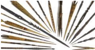
Een voorbeeld van de pijlencollectie PACE