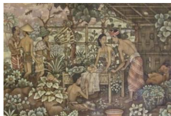
In Bethlehem – I Wayan Turun Bali - 1958

De mini-tentoonstelling onder deze titel die op de tweede zaterdag van september werd gehouden, is goed bezocht. Het weer was boven verwachting goed, wat meehielp aan het succes. Opvallend was dat bij meerdere bezoekers herinneringen aan de tijd dat het gebied nog Nederlands Nieuw-Guinea heette boven kwamen. Anderen wezen juist op de moeilijke positie die Papoea binnen de Indonesische republiek inneemt. Zending toen en nu kwamen op die manier dicht bij elkaar.