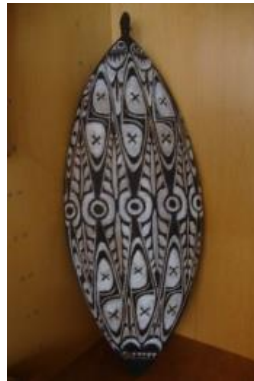
Papeda bord -Sentani