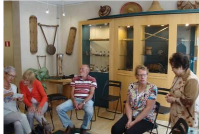
Oegstgeest op bezoek

partnerkerken ontvingen en bij hen op de kamer stonden.