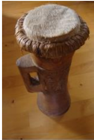
Trommel Sentani gebied