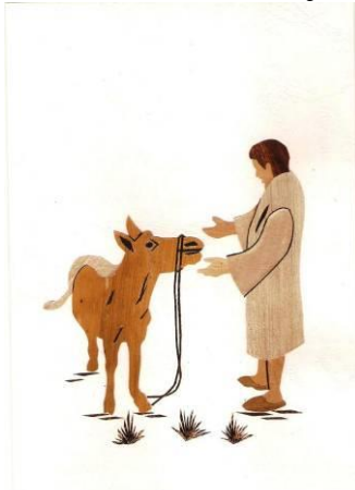
De ezel van Bileam

werden ook door de ZWO commissie rond de actie verkocht. We vroegen de zusters om speciaal voor het zendingserfgoedhuis een serie met Bijbelse thema's te maken. Dat is gebeurd en binnenkort zal de serie ingelijst en voor uitleen beschikbaar zijn.