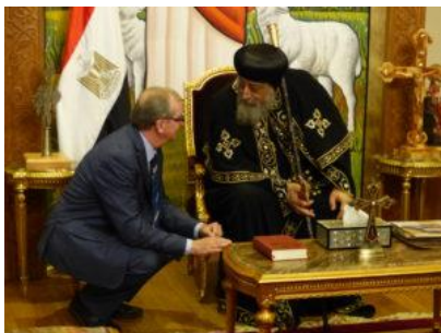
De voorzitter met Paus Tawadros II van de Koptisch-Orthodoxe Kerk