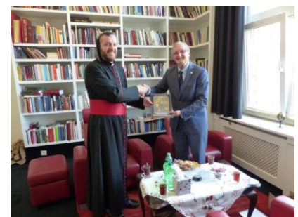
Mar Polycarpus ontvangt zendingserfgoedkalender

Begin november verscheen, van de hand van Huub Lems, een boekje bij de kalender van 2018. Meestal spreken de platen die de zendingserfgoedkalender sieren, voor zichzelf. Dat is met iconen wat ingewikkelder. Iconen, ook wel 'vensters op de hemel' genoemd, zitten zo vol symboliek in voorstelling, weergave en bijvoorbeeld kleur, dat het nuttig leek er dit keer, ter verduidelijking, een handleiding bij te schrijven. Dit om de iconen, bij wijze van spreken, te kunnen 'lezen'. Het bleek inderdaad nuttig, want er blijkt veel vraag naar de boekjes te zijn.