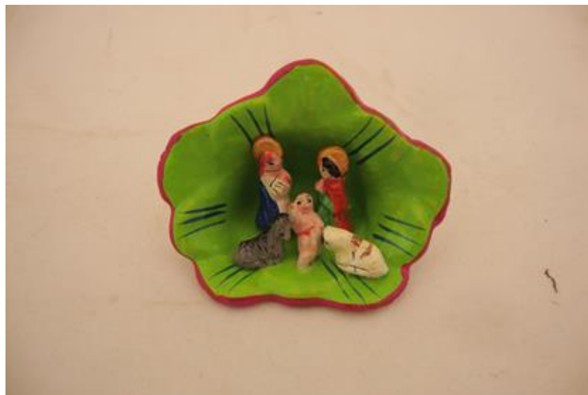
Kersttafereel uit Peru

De medewerkers van het Zendingserfgoedhuis wensen u gezegende Kerstdagen en een voorspoedig 2018.