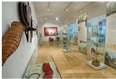
Museum Auf der Hardt Wuppertal