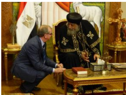
De voorzitter met Paus Tawadros II van de Koptisch-Orthodoxe Kerk