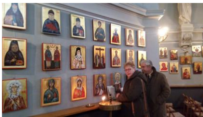
Iconen in Roemeens-Orthodoxe Kerk Schiedam

bijwonen van de kerkdienst was er een ontmoeting met aartspriester Ioan en er was gelegenheid om de rijke verzameling iconen te bekijken.