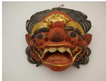
Barong masker Bali