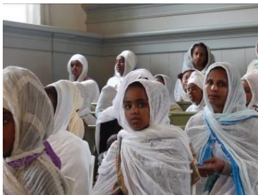
Eritrees-Orthodoxe kerk – Oudorp

Tineke Vlaming en Huub Lems bezochten de Syrisch-Orthodoxe kerk in Glane, de Armeens-Apostolische kerk te Almelo, de Koptisch-Orthodoxe kerk te Utrecht, de Ethiopisch-Orthodoxe kerk te Pernis bij Rotterdam en de Eritrees-Orthodoxe kerk te Oudorp bij Alkmaar om de afbeeldingen te fotograferen. De kerken hadden hen hiervoor toestemming verleend. Het was een ware ontdekkingstocht die uitnodigde de kerken beter te leren kennen, want ook zij maken deel uit van het christendom in ons land.